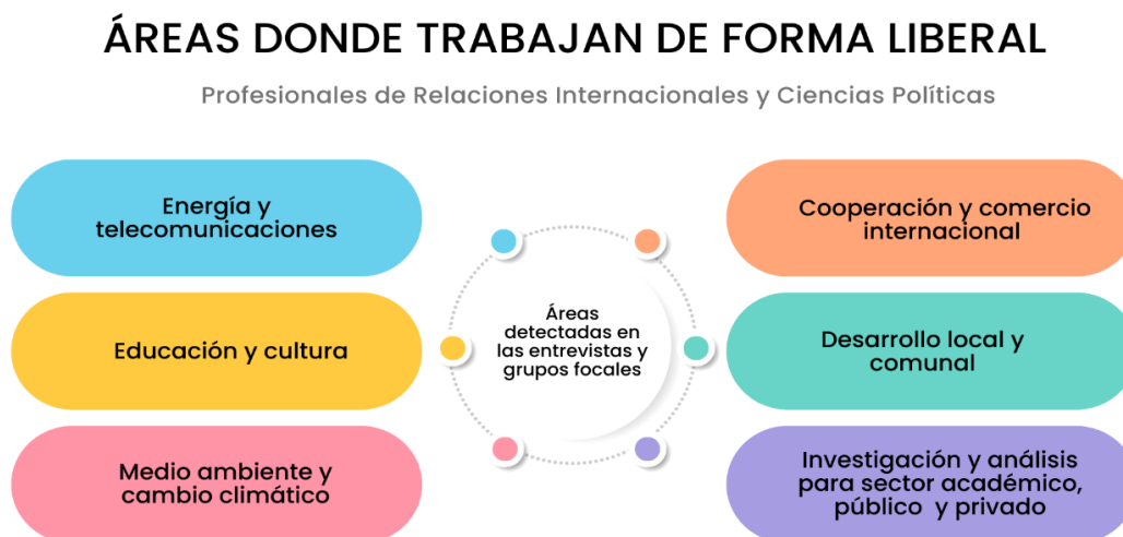
Figura 4 Áreas temáticas donde trabajan de forma liberal