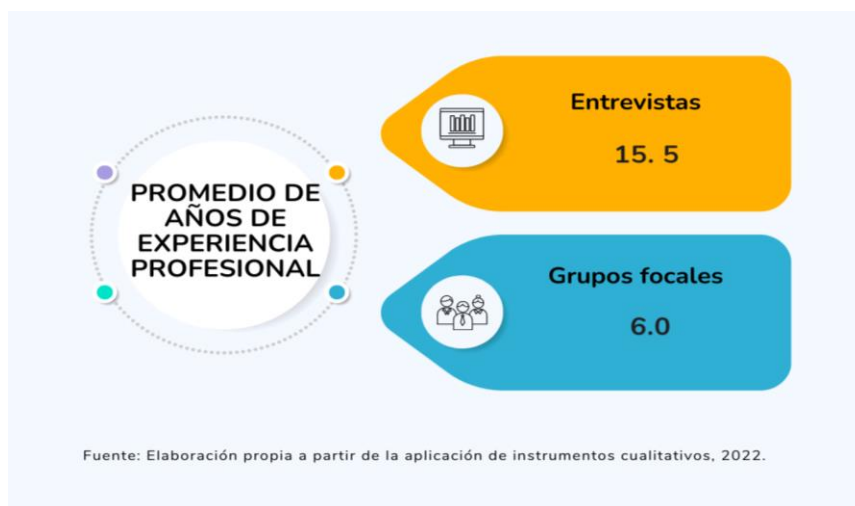
Figura 3 Promedio de años de experiencia profesional

En el caso de los grupos focales, las personas participantes, tienen un promedio de seis años laborados, ya sea desde el sector de los servicios profesionales o desde las contrataciones fijas por planilla. Se destaca que, hay una mayor frecuencia de menciones en torno a la inserción laboral en empresa privada.