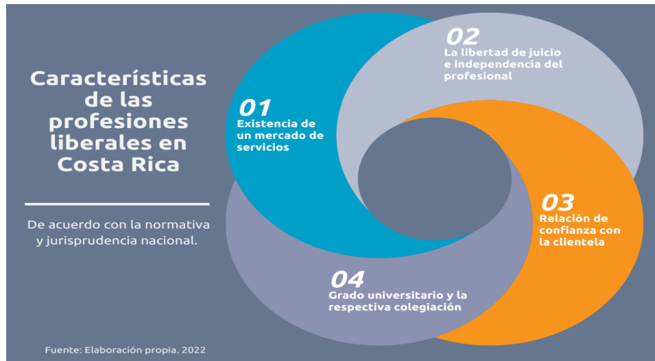
Figura 2 Características de las profesiones liberales en Costa Rica