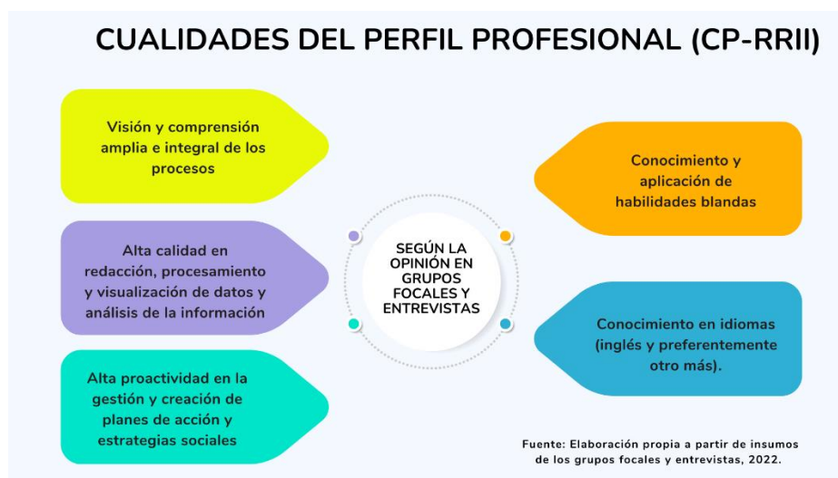
Figura 5 Cualidades del perfil profesional (CP-RRII)

Asimismo, durante las entrevistas todas las personas destacaron la importancia de llevar las Ciencias Políticas y las Relaciones Internacionales a áreas no tradicionales de trabajo e investigación, donde la demanda de profesionales con esta especialidad es alta, según sus criterios; se destacan temas relacionados al medio ambiente, comercio internacional, manejo y tratamiento de redes sociales e internet y análisis económico, entre otras áreas.