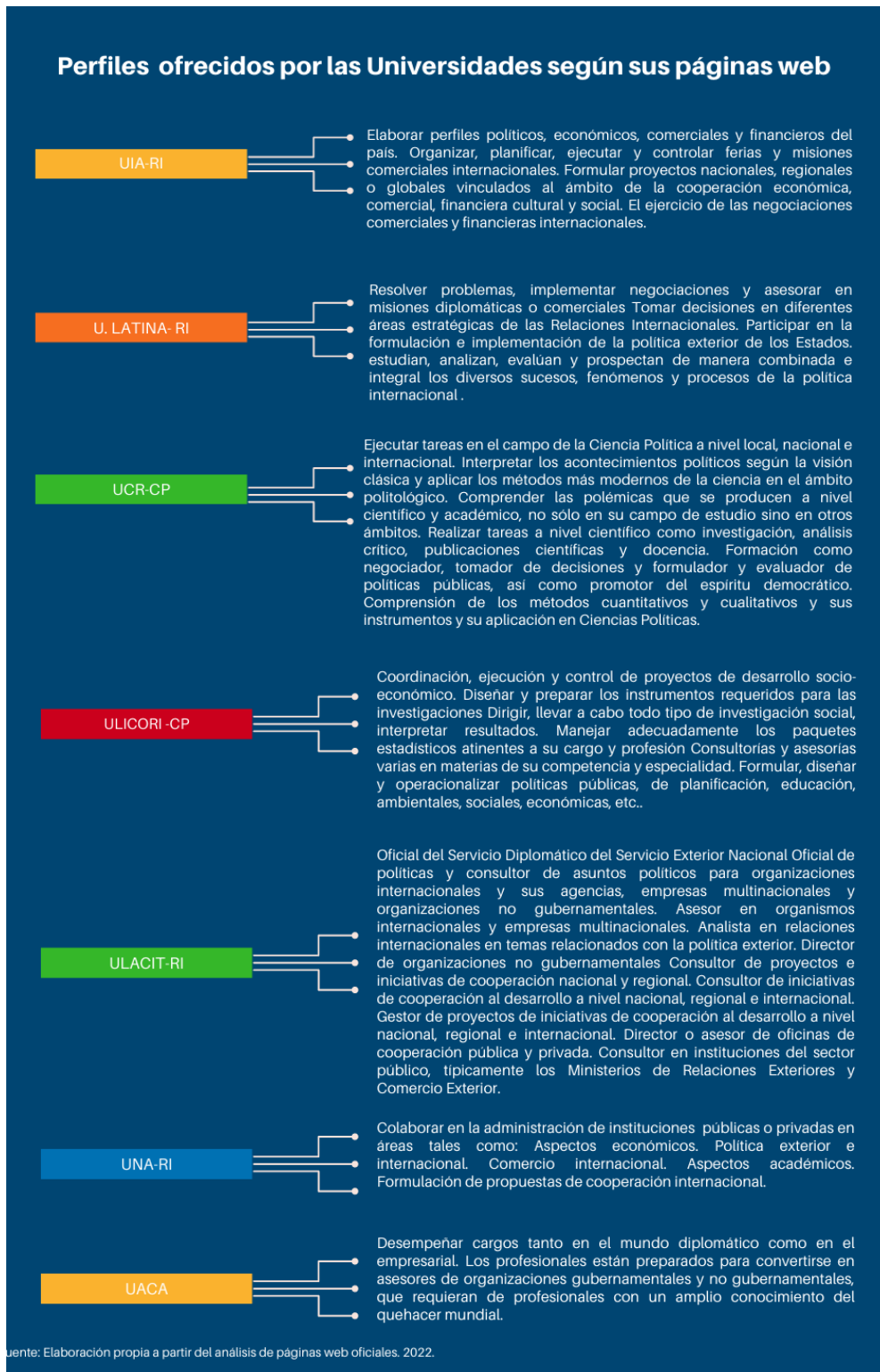
Figura 1 Perfiles Ofrecidos por las Universidades según sus páginas Web