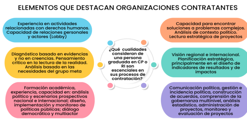
Figura 6 Elementos que destacan organizaciones contratantes

Fuente: Elaboración propia a partir resultados de la aplicación de herramientas cualitativas, 2022.